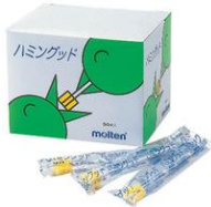
モルテン ハミングッド(50本入)