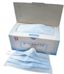
サージカルマスク (50枚)