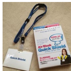
クイックシールドエアーマスク (ネームホルダー)