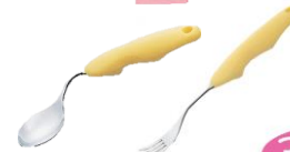
(パルーンスプーン・フォーク)

柄が太く軽くできています。指をかけやすく、握力が低下していても握りやすくなります。口に運びやすい角度に曲げて使うことができます。