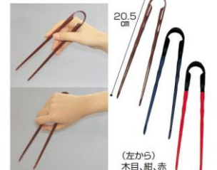
(ソフトバリアフリーはし)