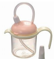
(ストロー付カップ)

フタやストローのついたコップで、倒したりかたむけたりしても、中身がこぼれないようにできています。