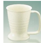
(やさしいマグカップ)